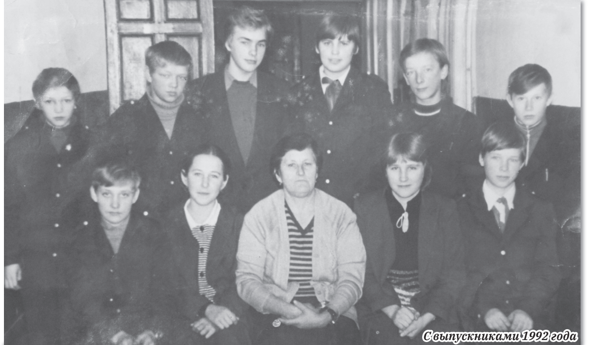
С выпускниками 1992 года