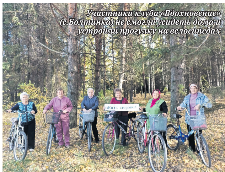
Участники клуба «Вдохновение» (с.Болтинка) не смогли усидеть дома и устроили прогулку на велосипедах