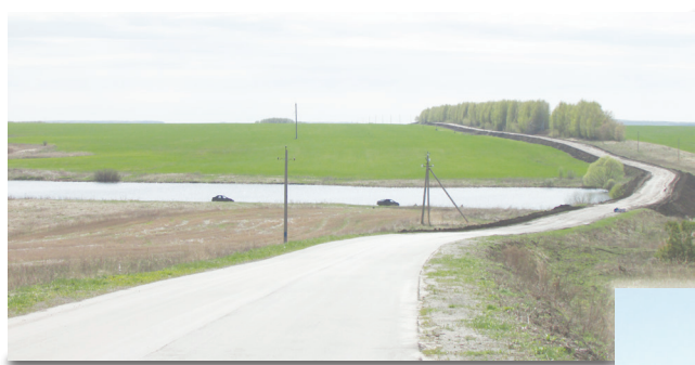
● Дорога на Васильевку разделена надвое: отремонтированная (от трассы) и бездорожье за прудом, где сейчас идут работы

Два года назад государственное управление автомобильных дорог включило в план первые два километра, которые построил «Дарнит». Вторая часть пути стала переходящим объектом строительства с 2017 года. Осенью ООО «Девис» поднял обочину для расширения полотна до шести метров. Руководитель предприятия говорит, что грунта «пере-