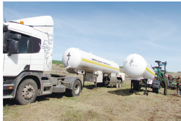
● На поле, где внесли безводный аммиак, будет расти рапс

Семена зерновых заложены в почву на 10290 гектарах. Если в «Мамлейском» очень оперативно посеяли 3000 га, то в ряде хозяйств погода до сих пор не дает широко развернуться. Четыре сельхозпредприятия посеяли 762 га масличных культур. Озимые подкормлены на 10180 га, в т.ч. с самолета – на 1200 га. Минеральные удобрения закупили лишь несколько хозяйств в объеме 2535 т. Сейчас это большое удовольствие, мелкие фермеры сеют обычно без них.