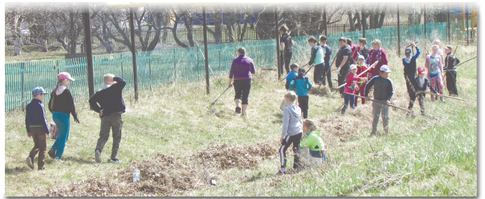
● Субботник в Кочетовской школе