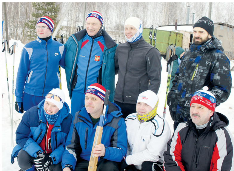
● Великолепная восьмерка: пришли, увидели, победили