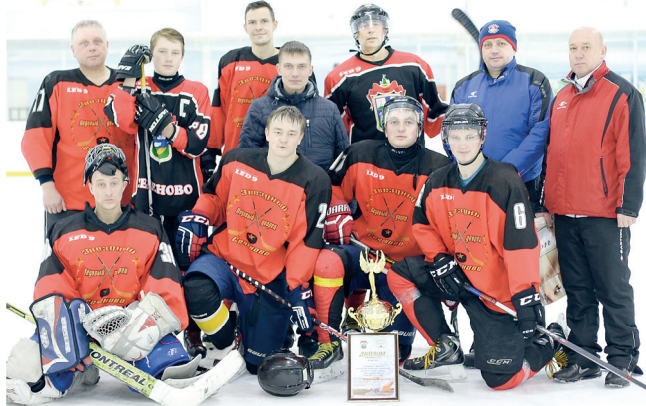
● Команда «Звездный» (ЛД)

просто друг, задаешься вопросом «А чем хуже я?» Огромные слова благодарности всем тем, кто так или иначе был связан с данным турниром. Все мы делали общее дело, и каждый вложил частичку своей души.