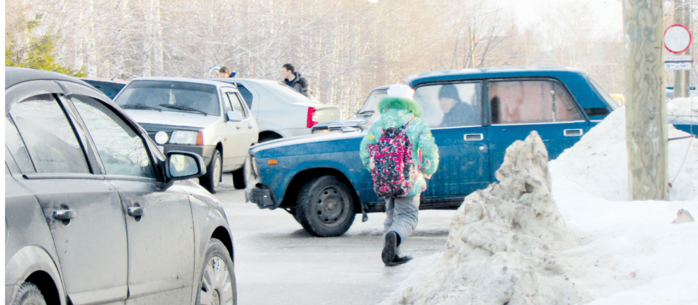
● По дороге в школу

Утро. 7.40. 300-метровый отрезок дороги на ул. Школьной забит техникой полностью. 15-20 машин проходит за десять минут.