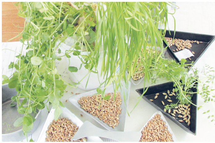
● Всходы-2017 пшеницы, гороха, ячменя и даже... нута

многие партии поражены в той или иной степени, а значит, требуют обязательного протравливания. При высокой степени заражения необходимо, чтобы в составе протравителя было 2-3 химических компонента.