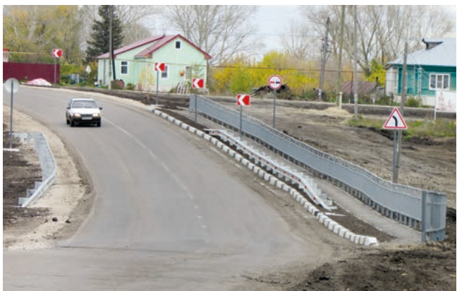
● И улица сразу преобразилась

В народе называют этот объект мостом. Комиссия ГУАД приняла его в эксплуатацию. Сделан не только переезд через овраг, но и тротуар, правда, у жителей окрестной улицы Садовой пока остались вопросы по обустройству территории, где брали грунт и где была обездвижена дорога.