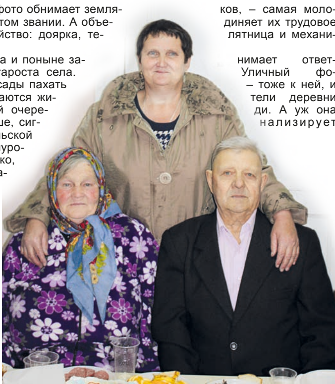
● Николаевские ветераны. Как в песне: дорогие мои земляки...

И все же пасмурный осенний день, повседневные заботы и проблемы не лишили людей хорошего настроения. Отметили пенсионеры Николаевки свой праздник весело.