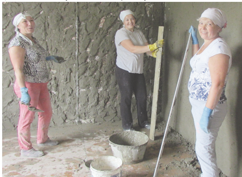
● Работа спорится

Терапевтическое отделение ЦРБ не узнать. От прежней штукатурки ничего не осталось. Кирпичную кладку укрепили, штукатурят, накладывают плитку. Бригадир шутит: «Не успеваю выдавать цемент, по десятку мешков в день расходуют».