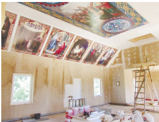
● Роспись в храме

ПРИ ВЪЕЗДЕ В СТАРЦЕВ УГОЛ аншлаг — Московский патриархат Саранская и Мордовская митрополия Ардатовская епархия Спасо-Преображенская мужская пустынь Старцев Угол — и указатель. А вот уже за кустами и деревьями виднеется домик, с первого взгляда видно, что временное жилье. Две зимы он здесь уже простоял. С минувшей осталась куча неиспользованных дров. Тропинка не нахоженная, подтверждающая, что живет здесь всего один человек, о чем нам и говорили знающие люди. По-