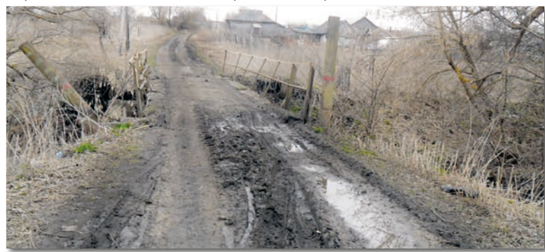
● Ну разве это дорога?

– Объект действительно важный. В распутицу к самому кладбищу невозможно подъехать. И если не отремонтировать мост, через некоторое время проехать к кладбищу можно будет только по объездной через Бегичево. Так что выбор сделан верный.