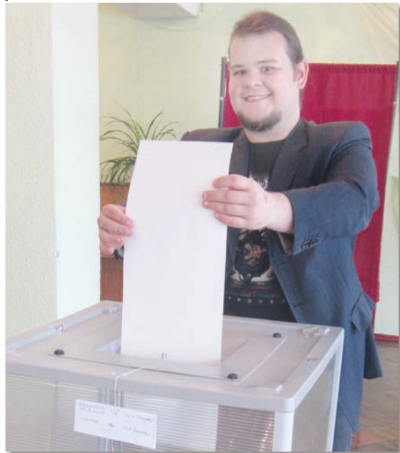
● 22 мая, на счетном участке в Сеченове

По всей области было открыто почти 450 счетных участков, явка составила 9,88%.