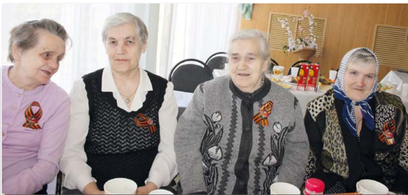
● Дети войны, рожденные в конце 30-х годов, сороковых-роковых