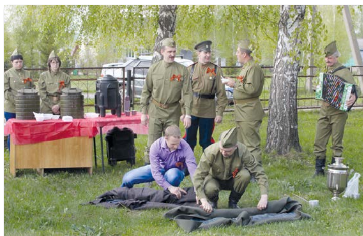
● Свернуть солдатскую шинель – дело непростое

Песни, призванные поднять боевой дух, вселить уверенность, что он обязательно настанет, тот долгожданный день – День Победы.