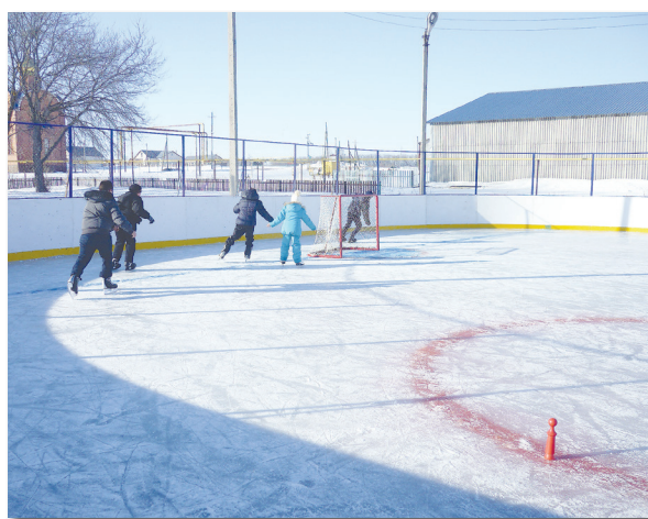
● Дни здоровья, уроки физкультуры, занятия группы продленного дня в Кочетовской школе проходят на новом хоккейном корте