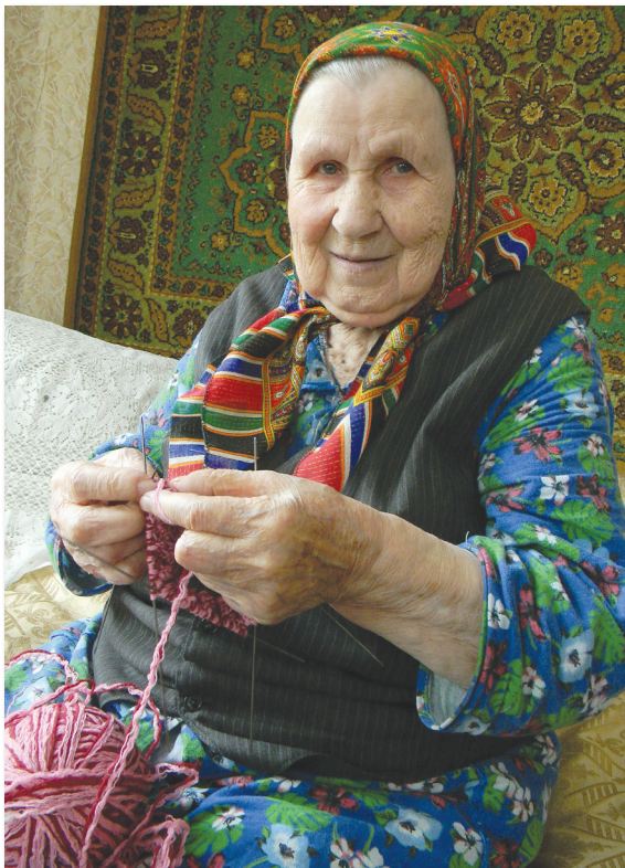
● Вязание — настоящее спасение. У пожилого человека дел мало, а без них скучно, сидеть-то старики не привыкли. А тут еще и польза — для всех будут носки

робка разноцветной пряжи — будут носки и теплы, и красивы. Да и чем еще занять длинные, однообразные дни, кои наступают в жизни каждого пожилого че-