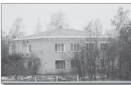
● Вчера крыши были еще не покрыты