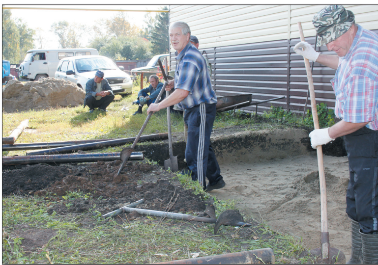
● Рабочие жилищно-коммунальной службы готовятся к заливке блоков под фундамент

Центральная котельная в В.Талызине дает тепло в десять многоквартирных домов, школу, детский сад. В этом году две двухэтажки на улице Комсомольской впервые уйдут в зиму полностью с индивидуальным отоплением, газовые котлы теперь в каждой квартире. А вот у домов №№1 и 2 на выездной улице Ивана Заикина будут построены две мини-котельные – своя у каждой трехэтажки.