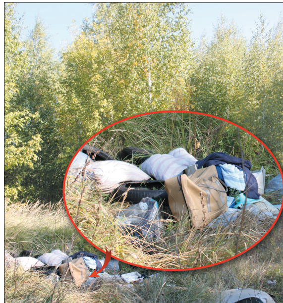
● Мусора пока что мало, но ведь главное – начало?!