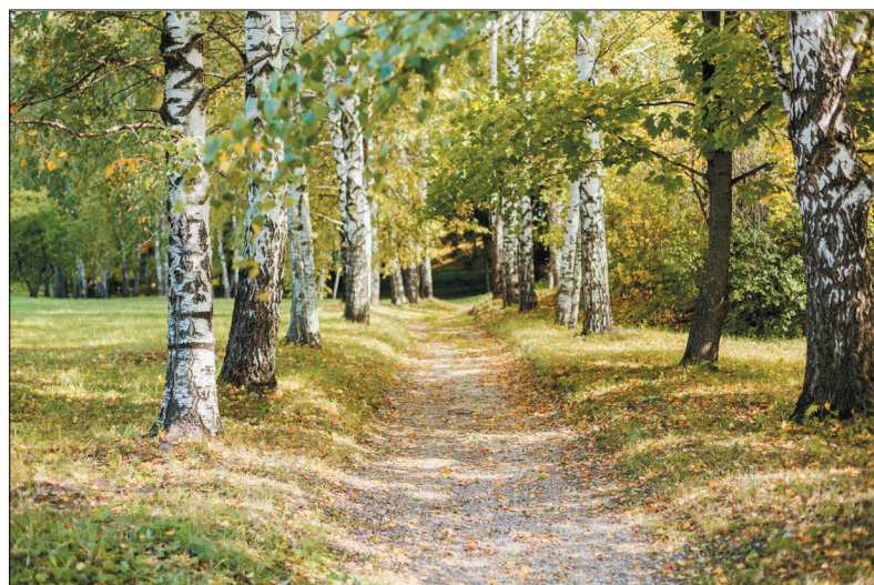
● Осенней порой можно отыскать много радующих глаз уголков природы. Один из них и запечатлен на снимке В. Володина

Это чудо – осенний лес. Никого не оставляет равнодушным. Скольких поэтов, художников вдохновил он на создание своих лучших произведений. Вот и зачитываются, засматриваются истинные любители природных тем в литературе и изобразительном искусстве. Ну а те, кому вообразить и представить мало, спешат вживую насладиться волшебством осени, спешат в лес.