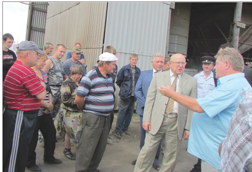
● Знакомство губернатора с рабочими сельхозпредприятия в Ильинке