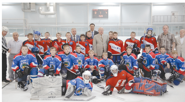
● Матч юных хоккеистов из Сергача и Сеченова закончился со счетом 9:3. Пока не в нашу пользу. Но, надеемся, только пока