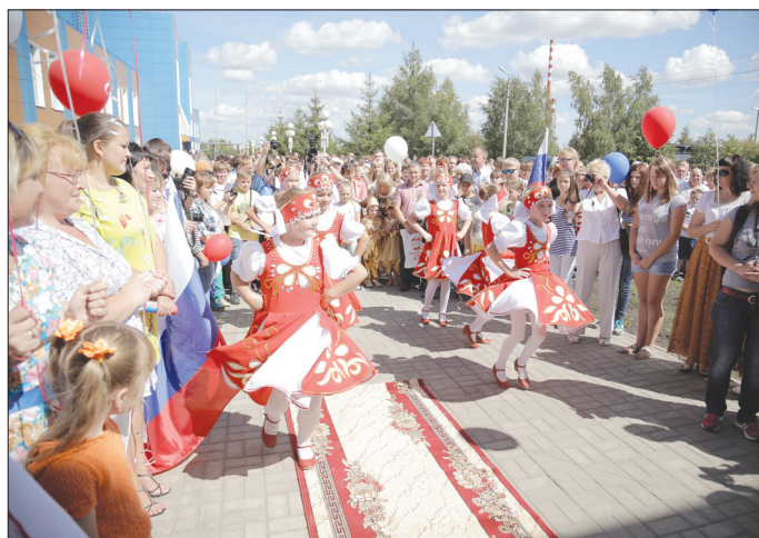
● Танец — украшение любого праздника. Особенно если его исполняют дети