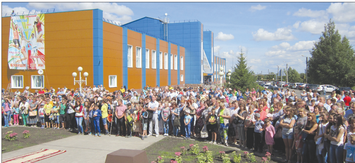
● Зрителей много, и интерес неподдельный