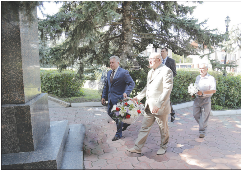
● Возложение цветов к памятнику И.М. Сеченова

По окончании церемонии открытия сеченовцы и гости села прошли по Ледовому дворцу. Еще долго на площадке перед «Звездным» и «Олимпийскими надеждами» было многолюдно и шумно.