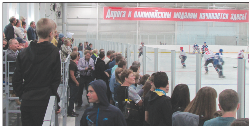
● В тот же день на ледовой арене дворца состоялся матч между командами Правительства Нижегородской области и сборной Сеченовского района. Наша команда проиграла со счетом 10:6.