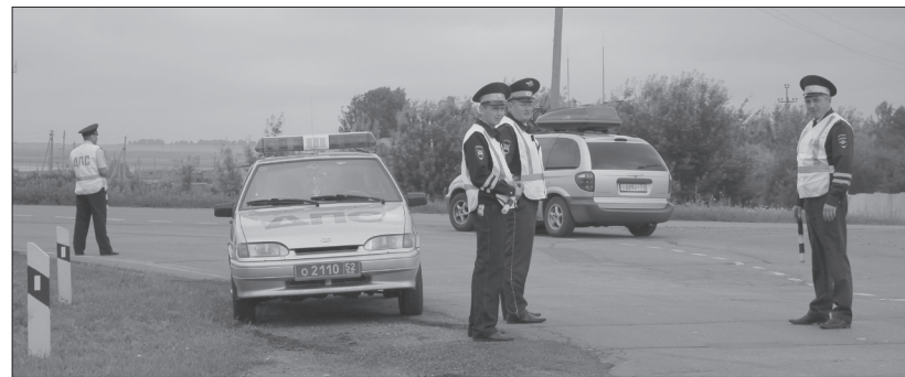
● Рейдовые мероприятия на дорогах района

Итоги рейда: один водитель отказался пройти медосвидетельствование на состояние опьянения; девять перевозили детей без детских кресел, семь водителей ехали без включения световых приборов.