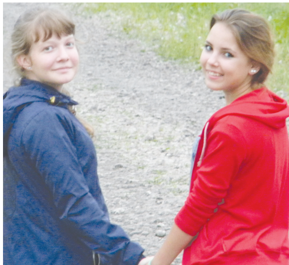
● «А у нас всегда хорошее настроение!»