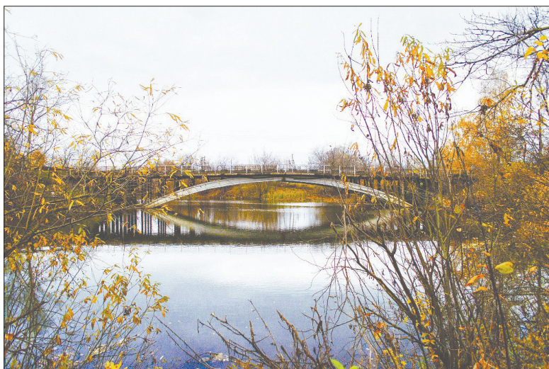
● П. Здюмаев. Мост через Медянку