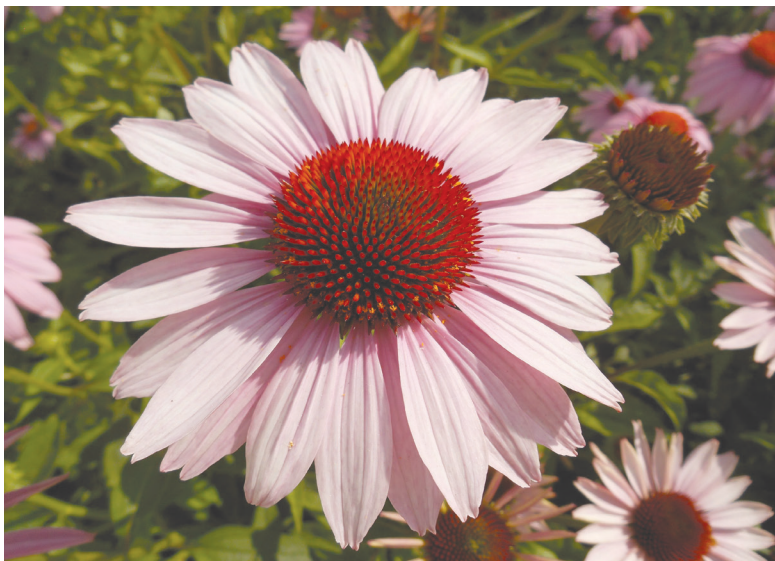
● П. Старков. Розовое солнце