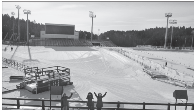
● Биатлонный центр в ожидании своего этапа кубка мира

ние 10 лет биатлонный центр принимает крупные международные соревнования, и многие «звездные» биатлонисты считают этот этап лучшим. В сезоне 2014-2015 он прошел несколько позже — с 17 по 22 марта. Какая досада, не хватило всего каких-то десяти дней, чтобы сбылась одна моя мечта — посмотреть биатлон не по телевизору (хотя это тоже очень интересно, и лучше видно), а живую, с трибуны самого стадиона.