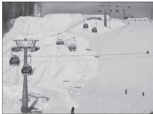
● Горнолыжный комплекс. Канатная дорога.