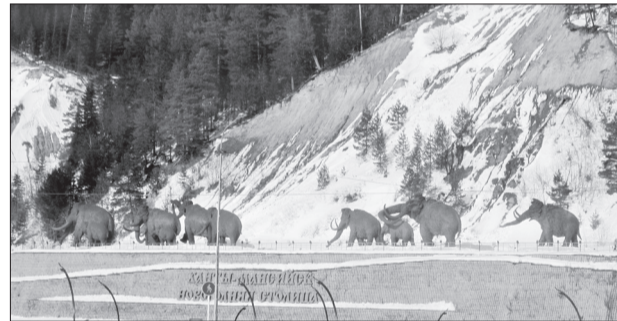
● Ханты-мансийские мамонты

Как живые, в натуральную величину, бронзовые мамонты — во всей красе предстает скульптурный комплекс