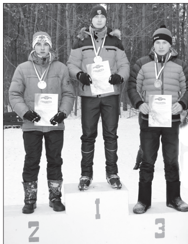
● Весь пьедестал наш!

Открытое индивидуальное первенство Сеченовского муниципального района по лыжным гонкам — межрайонные соревнования — собралось большое количество участников: 11 школ нашего района, агротехникум, спортсмены Починковского, Гагинского районов и Ардатова (Республика Мордовия) — всего 140 спортсменов. Состязались юные лыжники в четырех возрастных группах.