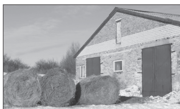
● Сено сухое, в нужном цвете и около самой фермы

Коровник рассчитан на 200 голов, фактически же пока заполнен чуть больше, чем наполовину. А вот задумок, а вместе с тем и проблем, в первую очередь финансовых, — полный комплект. Еще тогда, в начале, имели договоренность с ижевской фирмой на поставку молокопровода и охладительного танка, но не сложилось, вот и теперь глава Ф/Х рассматривает варианты, хочет оптимально эффективно решить этот вопрос. Коровам нужны сочные корма — силос, а значит, и кормоуборочный комбайн. Стоит он недешево (6 млн. рублей), тогда как яма для закладки силоса имеется, за этим дело бы не стало. Нужен миксер (измельчитель для грубых кормов, того же рулонного сена), хотя это, наверное, мелочь на фоне планируемых затрат.