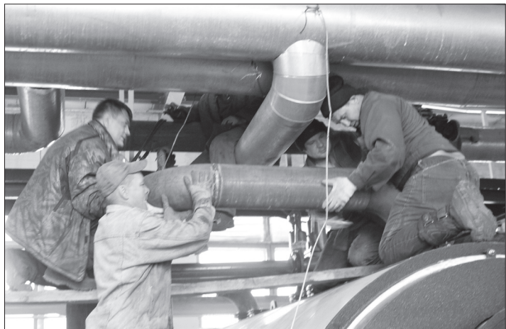
● Идет установка оборудования