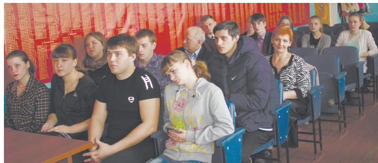
● Участники встречи