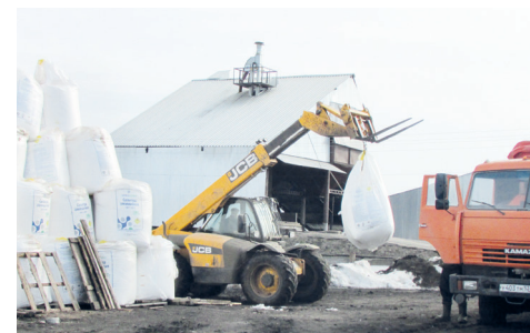
● Удобрения к новому урожаю. В районе заготовлено их 1290 тонн, 30% от потребности