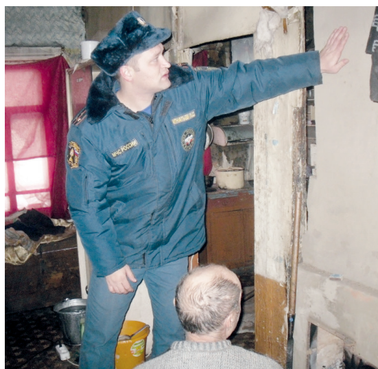
● В ходе рейдовых мероприятий: безопасность прежде всего

В целях предупреждения пожаров и гибели на них людей, повышения уровня противопожарной защиты жилья профилактической группой в составе сотрудников отделения надзорной деятельности по Сеченовскому району, отделения полиции совместно с представителями администрации, органов соцзащиты населения проводятся профилактические рейды по местам проживания лиц, злоупотребляющих спиртными напитками, многодетных семей.