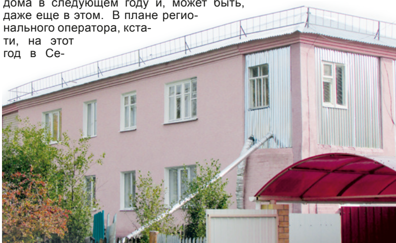
● Дом №11 по ул. Пионерской райцентра в новом «цвете»

дома в следующем году и, может быть, даже еще в этом. В плане регионального оператора, кстати, на этот год в Се-