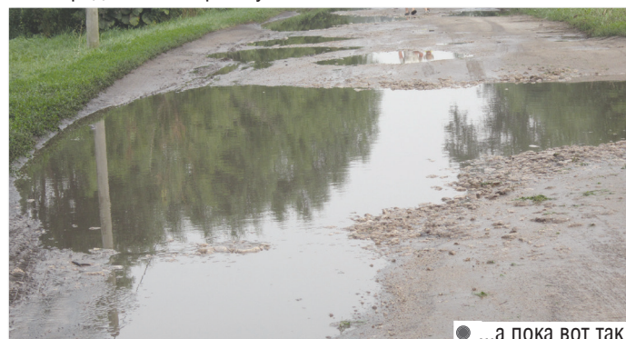
● ...а пока вот так