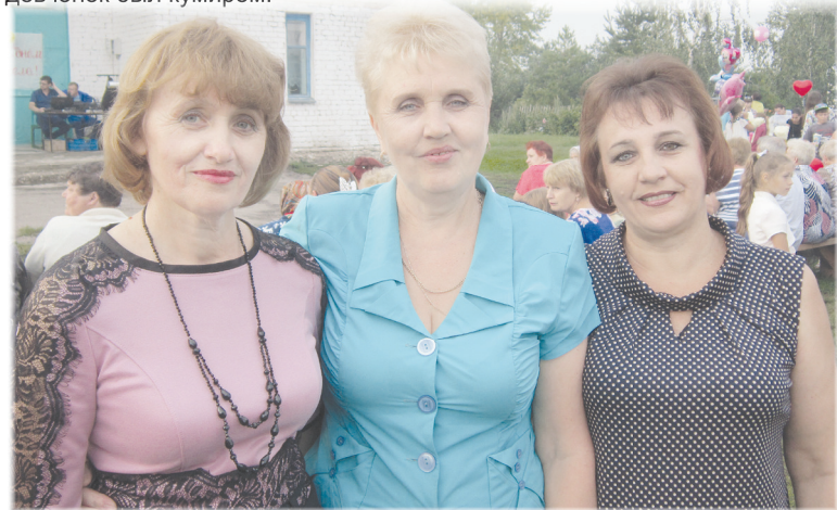
● Все вместе — счастливые моменты