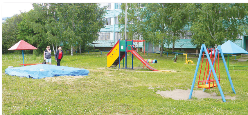
● Взрослые заботливо укрывают песочницу, все на площадке — для детей

Но молодцы жители Советской, мамы, папы, бабушки и дедушки: ни себя, ни детей в обиду не дадут.