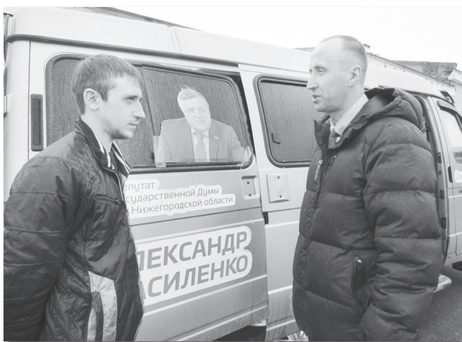
● «Ситуацию по дорогам надо менять в целом по стране»