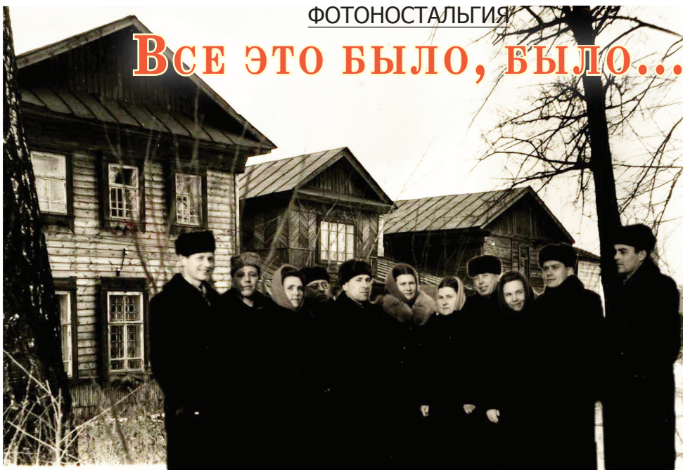
● Сотрудники райкома и райисполкома возле старого здания. Снимок конца 50-х – начала 60-х гг.