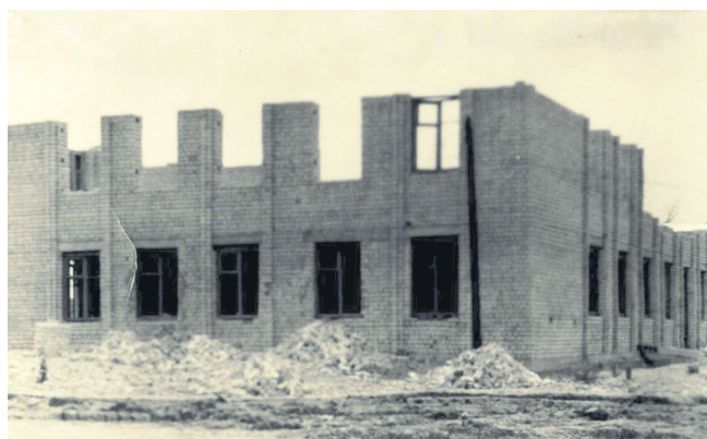
● Сегодняшнее здание администрации района в начале строительства