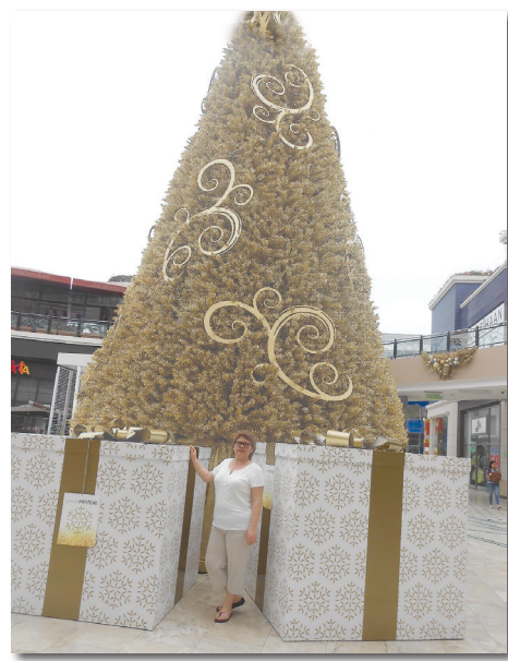
● Вот такой Новый год в столице Перу - Лиме