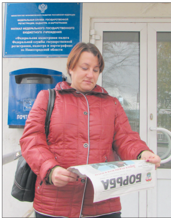
● Районную газету всегда ждут

Все мы прекрасно понимаем, если и дальше будет так продолжаться, часть людей не станет платить за некачественную услугу, тем самым лишится изданий, с которыми идут по жизни, ну а мы, безусловно, потеряем подписчиков. Нетрудно представить, что ждет в дальнейшем почтовые отделения свя-