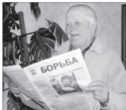
● Приятно и о себе почитать в газете

Петропавловки к тому времени уже не стало, родители купили дом в Александровке, переехали туда. Бывали здесь в гостях нечасто — не ближний свет. Картошку, капусту, морковку и прочие овощи выращивали сами, яго-