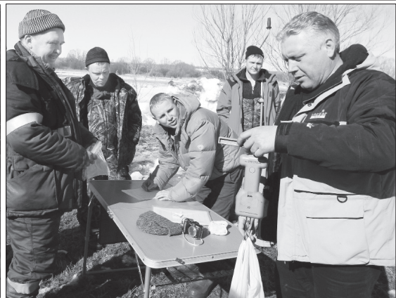
● Улов — на взвешивание