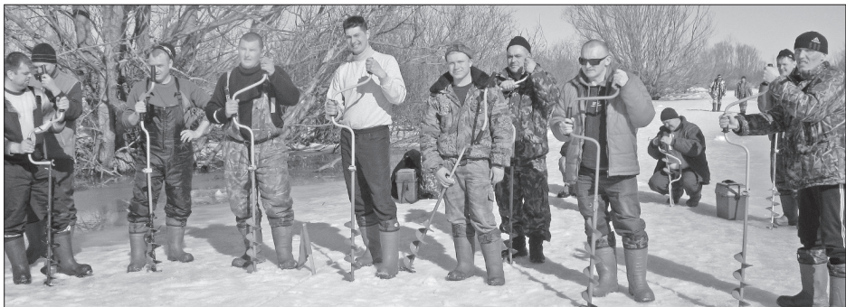
● К бурению готовы!

ведущие как вопросами, непосредственно относящимися к охоте и рыбалке, так и далекие от этого, но, как говорится, близкие по духу. Заглянул «на костерок» и руководитель мест-