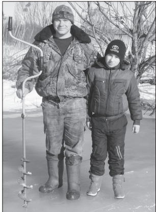
● Бери пример со старшего